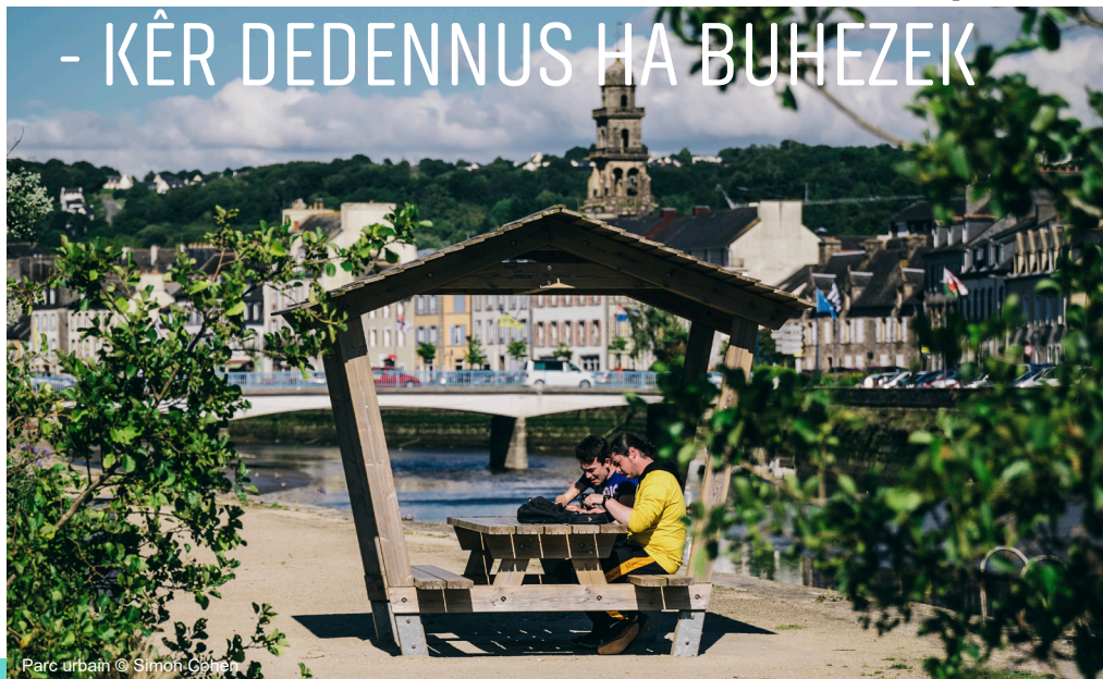
Parc urbain