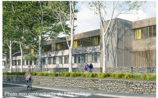
Photo non contractuelle du futur collège