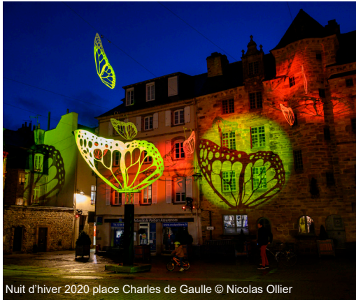
Nuit d'hiver 2020 place Charles de Gaulle