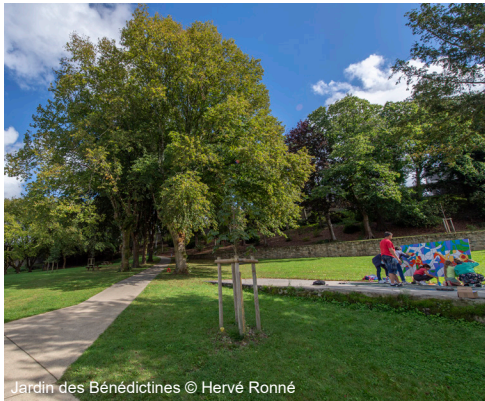
Jardin des Bénédictines