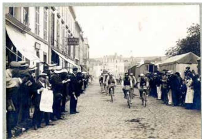
Passage du Tour de France en 1910