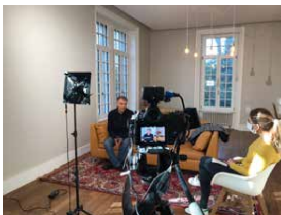
Interview de Guy Le Gall diffusée le 26 février - © Tydeo

D'ici juin, le 26 de chaque mois, le service propose une capsule vidéo dédiée pour présenter des acteurs du Tour de France, des cyclistes locaux ou encore des personnalités sportives du territoire.