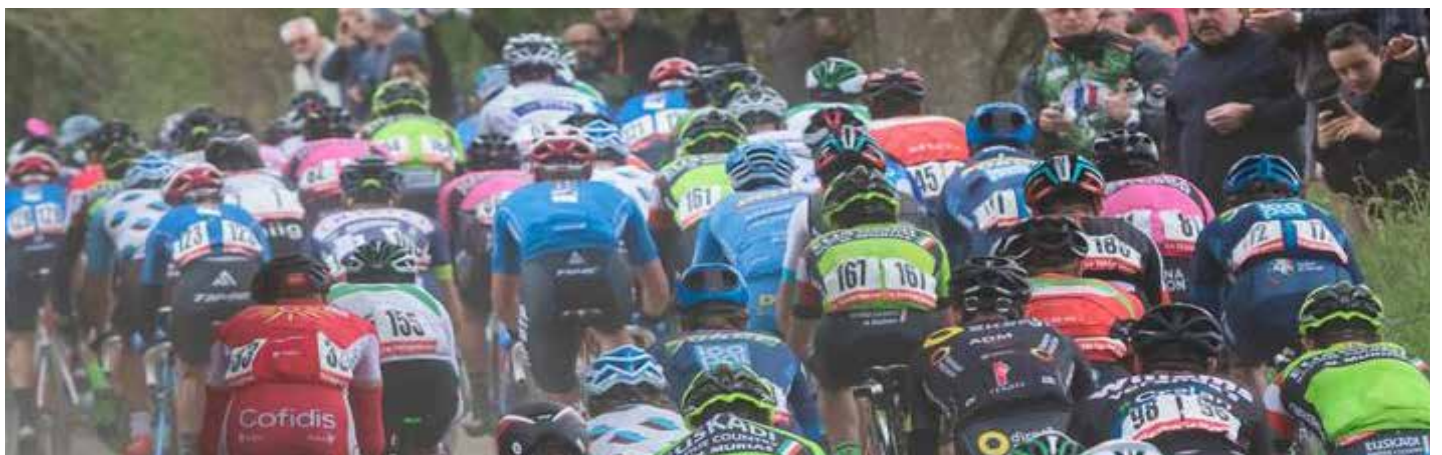
Tro Bro Leon 2018 - Ribin de Landerneau

La mythique course finistérienne revient pour sa 37 ème édition le dimanche 16 mai. Pour la première fois, les coureurs graviront la fameuse « côte des antennes », rue de la Fosse aux Loups. Certains d'entre-eux devraient profiter de leur passage pour effectuer quelques repérages.