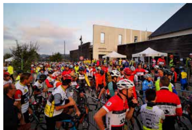
Souvenir Michel Tanné 2019