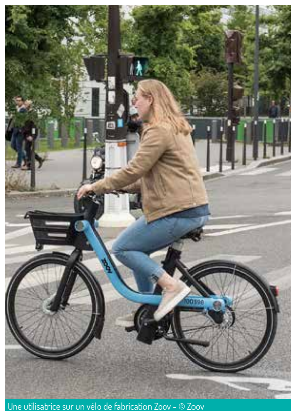
Une utilisatrice sur un vélo de fabrication Zoov

La crise sanitaire ne permettant pas de rassembler les écoliers dans un même lieu. La Ville a donc contacté 9 personnalités pour assurer la lecture du texte retenu par A.S.O.